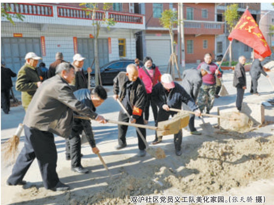
双沪社区党员义工队美化家园。

有了“美丽厦门战略规划”的指引,如今,双沪社区迈向“美丽乡村”的步伐大大加快。经过近一个月的美化提升,社区内的主干道,俨然变成了一个绿意盎然的彩色长廊。社区通过对“两横三纵”干道即双